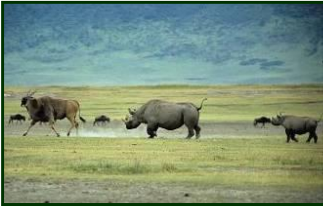
Etape pour rejoindre la région d'Olduvai.